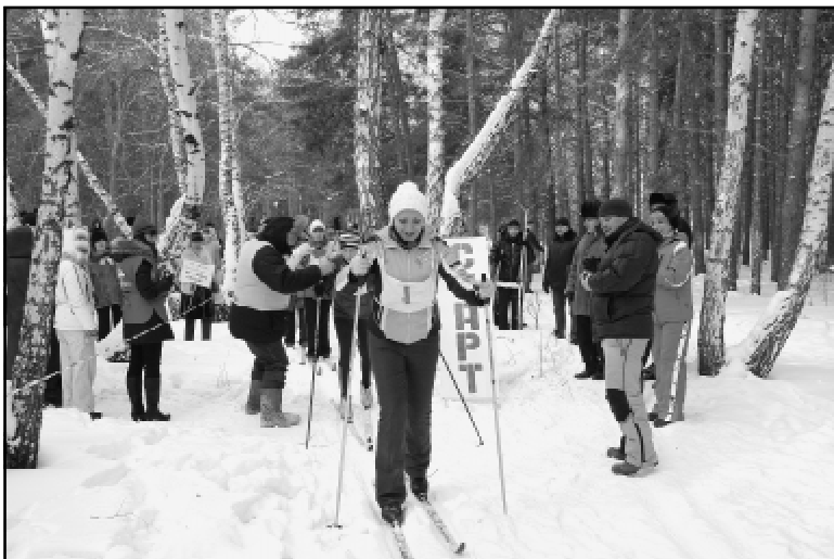
Лыжные гонки - традиционный вид зимней спартакиады.