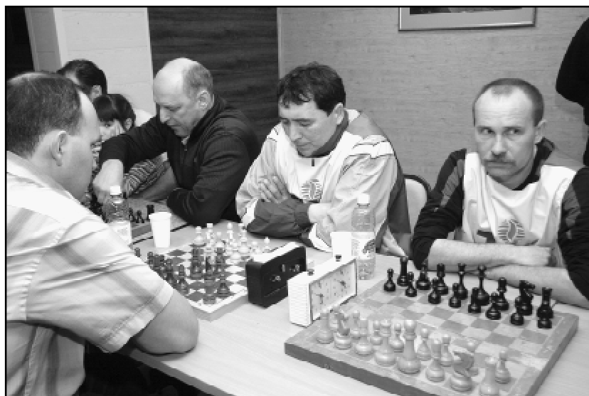
В ожидании соперника.

В предпраздничные дни, 19-21 февраля, в селе Красноярка на базе санатория-профилактория "Коммунальник" прошла 39-я зимняя спартакиада областной профсоюзной организации работников жизнеобеспечения. Это ежегодное мероприятие пользуется большой популярностью среди жилищников и коммунальщиков и всегда собирает значительное количество участников. И всякий раз оно посвящается какому-то важному событию: например, в прошлом году - 90-летию отраслевого профсоюза, в этом - 65-летию Победы в Великой Отечественной войне.